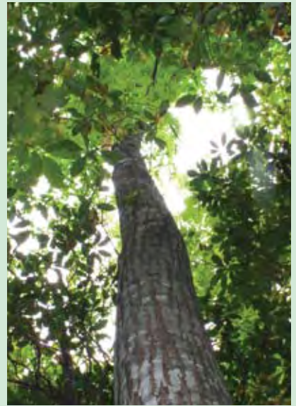
Castaño americano nativo en estado silvestre, árbol superviviente que se ha librado de la enfermedad de la roya del castaño.

Resumido por A. Yanchuk, de Burnham (1990) y la Fundación Americana del Castaño ( www.acf.org )