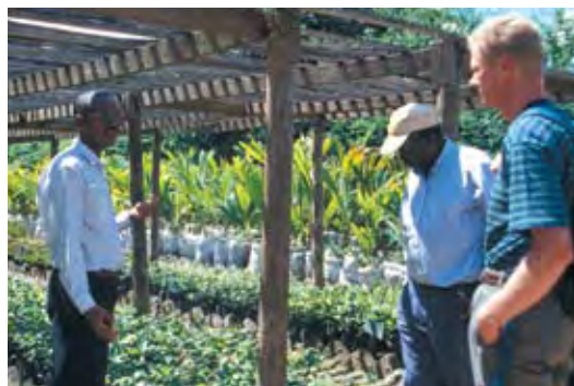
El Organismo de Semillas de Árboles de Tanzania realiza un trabajo pionero con especies indígenas mientras los árboles populares atraen a los clientes al vivero e incrementan el conocimiento público.