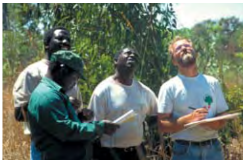
Evaluando el éxito de la conservación ex situ de pinos tropicales.

Las poblaciones naturales de Pinus caribaea , P. oocarpa y P. tecunumanii en Centro América están bajo intensa presión de la agricultura, el pastoreo, la explotación excesiva y los incendios. Por esta razón, se estableció a finales de la década de 1970 una red de rodales de conservación ex situ de las tres especies de pino (FAO 1985). El Centro de Semilla Forestal de Dinamarca (CSFD) y la FAO evaluaron recientemente rodales en ocho países diferentes para documentar su estado de conservación. El estudio incluyó 135 rodales de conservación ex situ con una