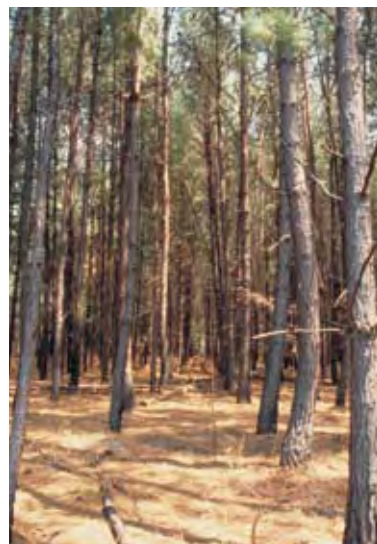
La falta de aclareos en un rodal de conservación ex situ de Pinus tecunumanii limita la producción de semilla y compromete la regeneración (Chati, Zambia, 1997).