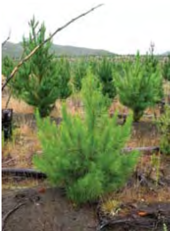
Plantación joven de Pinus radiata en Nueva Zelanda.

La selección artificial incluye la selección de individuos para reproducir la siguiente generación, lo que tiene el efecto de cambiar el fenotipo medio para las características