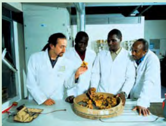
Proyecto Milenium del Banco de Semillas. Científicos de Kenia discuten el tratamiento de la semilla del Combretum collinum con un miembro del personal de RBG Kew, en el Edificio de Wellcome Trust Millennium.

A fin de reducir al mínimo la necesidad de regeneración, con todos los problemas relacionados, es importante conseguir el máximo de vida de la muestra. Por ello, un programa importante de investigación, basado en unos 25 años de experiencia, sirve de base al proyecto. Este trabajo mantiene una importante iniciativa de formación y una base de datos que deben facilitar la conservación de semillas en muchos países.