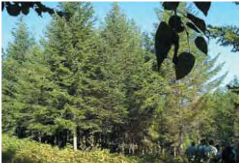
Ensayo de procedencias del abeto Douglas del interior de la Columbia Británica.

Como se mencionó anteriormente, pocas especies de árboles han estado sujetas a estudios genéticos de ámbito extenso (ensayos de procedencias) utilizando principios experimentales comunes de invernadero. Sin embargo, estos estudios han demostrado que, en general, la mayoría de las especies arbóreas forestales tienen modelos de adaptación en relación con el clima de donde tuvieron su origen. No obstante, también se conoce que las adaptaciones no pueden ser perfectas (Namkoong 1969), como resultado de efectos de retraso en la adaptación y normalmente de un vasto flujo de polen entre poblaciones. Además, diferentes especies