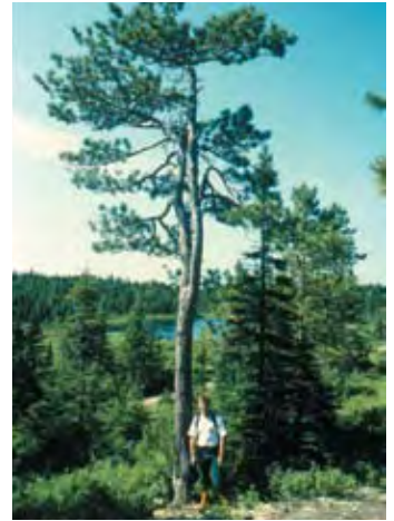
Un ejemplar de Pinus resinosa, probablemente uno de los más viejos de Norte América, de una edad aproximada de 360 años

Cuando se carece de un conocimiento previo de la variación genética a través de la distribución de la especie, las estrategias de muestreo para nuevos programas de mejoramiento genético han tendido a suponer: (1) que existen diferencias genéticas entre poblaciones, y (2) que éstas siguen gradientes ambientales, ecológicos, climáticos e incluso edáficos, a través de su distribución. Como se analizó en el Volumen 1, Capítulo 2, éste es un supuesto conservador pero que debe hacerse en la mayoría de los casos, con respecto a la “representación ecológica” en el muestreo. Para especies exóticas que se han llegado a naturalizar en un país (denominadas a veces ecotipos locales ), puede ser importante también considerar los efectos de procedencia. Si las diversas introducciones pueden ser rastreadas hasta sus orígenes, o si ha transcurrido un tiempo considerable desde que fueron introducidas, se pueden haber desarrollado diferencias entre las poblaciones. Estos diferentes ecotipos locales podrían ser un método importante para incluir algunas variaciones entre poblaciones en el muestreo inicial. Por ejemplo, los programas de mejoramiento genético de Pinus radiata han podido beneficiarse de las diferencias entre