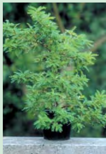
S. toromiro , un descendiente del último árbol silvestre sobreviviente de la Isla Oriental cultivado a partir de semilla en el Jardín Botánico de Copenhague. (Omar Ingerslev)

El Grupo de Manejo de Toromiro ha emprendido una búsqueda mundial y ha localizado todos los árboles disponibles de toromiro en cultivo. Un directorio de los árboles se mantiene en el Jardín Real Botánico de Kew, RU, con los datos asociados de la identificación de la huella genética. Es evidente que existe muy poca diversidad genética dentro de la población sobreviviente. La especie, según parece, persistió en poblaciones reducidas durante una serie de décadas; entre 1917 y 1960 probablemente persistió como un individuo silvestre. Es probable que este cuello de botella tenga consecuencias para la supervivencia a largo