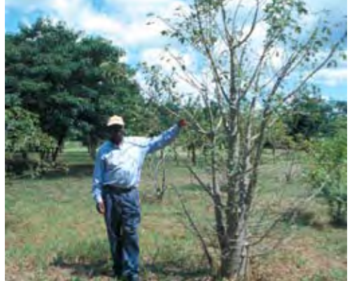
El Organismo de Semillas de Árboles de Tanzania ha establecido parcelas ex situ de árboles indígenas. Un rodal joven de baobab, especie valorada que raramente la población local. (Ida Theilade/FLD)

En general, la preparación del sitio mediante un cultivo completo es la mejor forma de asegurar una alta supervivencia, especialmente en climas con bajas precipitaciones y una larga estación seca. Sin embargo, hay que tener en cuenta siempre y con todo cuidado el riesgo de erosión y, en consecuencia, los rodales se deben establecer siempre que sea posible, en laderas suaves. Las técnicas y métodos de preparación del sitio, como ya se mencionó, deben basarse en los mejores conocimientos disponibles sobre cómo establecer una especie determinada en un medio de plantación y normalmente las cuestiones de preparación del sitio son parte integrante de los conocimientos selvícolas.