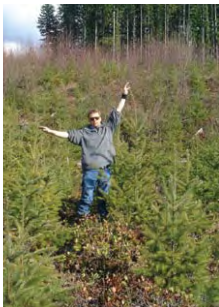
Ensayo de una joven progenie del abeto Douglas de la costa, establecido con un diseño de bloques incompletos.

Durante los últimos 30 años los viveristas han utilizado, cada vez más, técnicas que identifican y predicen con más precisión el valor genético, o valía de los árboles padres seleccionados (selección genotípica). El uso de la descendencia de un árbol madre ya sean estaquillas (clones) o brinzales, es una poderosa técnica para examinar el valor genético de cualquier parental. Con muchos árboles descendientes por padre, plantados en todos los sitios de ensayo con