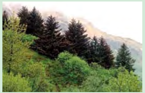
Una de las poblaciones más septentrionales y periféricas de la picea de Sitka en la Isla Kodiak, Alaska.

se necesitan mayores tamaños de muestras de población y de áreas muestreadas para captar cantidades comparables de “riqueza alélica” (número promedio de alelos por locus), en las poblaciones periféricas que en las poblaciones centrales, debido a la estructura más espacial de las poblaciones periféricas (individuos que crecen en grupos, que probablemente contendrán individuos emparentados). El muestreo se debe realizar en áreas más extensas en las poblaciones periféricas, a fin de romper esta estructura de vecindad. Por ejemplo, para poblaciones centrales de P. Sitchensis , una muestra de 150 árboles, con un espaciamiento interno mínimo de 30–50 m., muestreada a partir de 225–325 ha., sería adecuada para captar el 95% de la riqueza alélica, pero para poblaciones periféricas el área muestreada tendría que ampliarse por lo menos hasta 400 ha. Estos resultados demuestran que los estudios moleculares pueden proporcionar una información importante sobre estrategias de muestreo e incluso sobre el diseño de reservas para la conservación tanto ex situ como in situ .