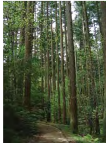
Rodal adulto de Pseudotsuga menziesii en Vallombrosa, Italia.

Los programas de selección artificial son considerados a veces por los críticos como “antinaturales” y la selección para algunos caracteres de importancia económica inmediata demostrará a la larga que esto es un error. Sin embargo, también es importante señalar que todos los genotipos individuales en la próxima generación, están todavía sujetos a muchas fuerzas de “selección natural”. Mediante cualquier mecanismo que utilicen los seres humanos para seleccionar árboles de interés, mejorarlos y replantar la próxima generación para selección, los cambios dirigidos por el hombre deben funcionar bien todavía en lo que es aún más importante para los desafíos ambientales inmediatos (Libby 2002). Todas las especies exóticas que han sido “naturalizadas” para sus nuevas áreas geográficas, han estado en gran medida sujetas a estas presiones de selección natural y han llegado a ser, sin embargo, importantes especies comerciales (como Pinus radiata y Pseudotsuga menziesii ) ampliando, en realidad, el propio recurso genético. Los otros dos procesos genéticos que afectan a la conservación y al mejoramiento genético de los árboles forestales (migración de genes y tamaño de la población) se analizan en la Sección 4.6.