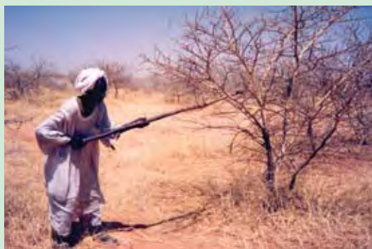
Extracción de goma de Acacia senegal var. senegal utilizando un sunki (herramienta con forma de palo) en una plantación de 12 años en El Obeid, Sudán.

El almacenamiento y distribución de la semilla estuvo a cargo del Centro de Semillas Forestales de Danida, Dinamarca (CSFD), y las semillas se distribuyeron para evaluación desde 1983 a 1989. Se establecieron ensayos de campo, con fracciones de los lotes de semilla, a cargo de 40 institutos y proyectos, en 22 países. Aunque el proyecto terminó oficialmente en 1987, se consideró necesaria una evaluación global de una serie de ensayos seleccionados, con los países interesados, a fin de lograr un primer conocimiento de la productividad de las especies y procedencias incluidas.